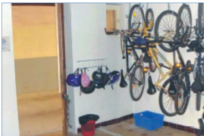
Accès rue direct (existence d'un second accès par l'immeuble)