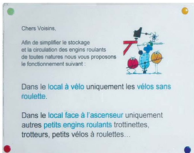
Affichette réalisée par une copropriétaire