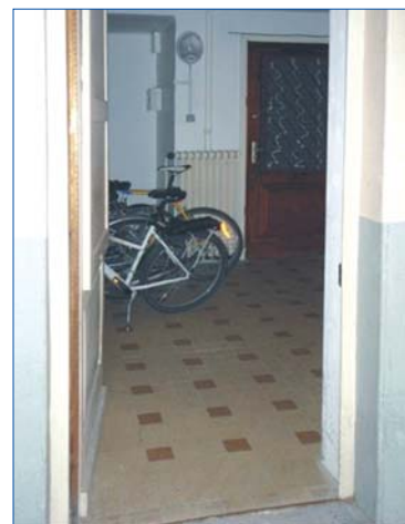
Aujourd'hui - Source : CETE de Lyon